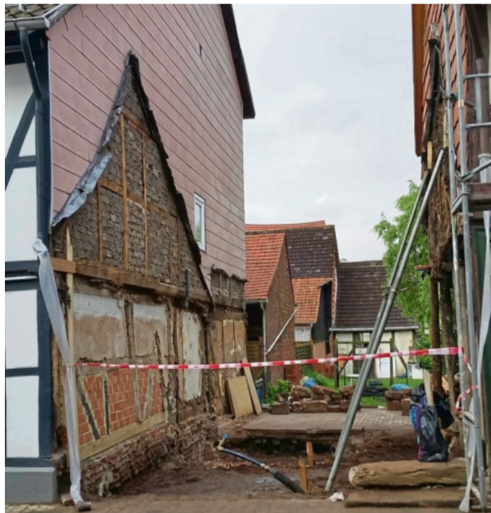
Kernsaniierung bis auf die Grundmauern: Bevor es losging, musste erst einmal das alte Gebäude abgerissen werden.

Zur Einweihung der neuen Räumlichkeiten lädt das FAZ am Samstag, 15. September in der Zeit von 11 bis 16 Uhr herzlich zu einem „Tag der offenen Tür“ ein. Für das leibliche Wohl ist bestens gesorgt. Nähere Informationen unter Tel.: 0 56 52 / 91 72 65. (dan)