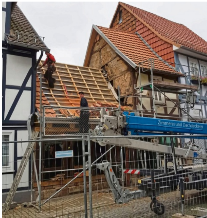
Die Lücke schließen: Mit den Dacharbeiten nimmt die Erweiterung zunehmend Gestalt an.