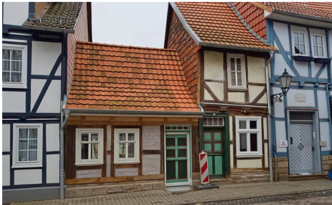
Eine gelungene Rekonstruktion: Am 15. September wird das Familienzentrum seiner neuen Bestimmung übergeben.

Nachdem die Stadt Bad Sooden-Allendorf erfolgreich den Antrag auf Genehmigung einer 75 prozentigen Förderung durch das LEADER-Programm gestellt hatte, konnte man im Mai 2017 mit den Bauarbeiten beginnen. Das FAZ trägt dabei den Eigenanteil von 25 Pro-